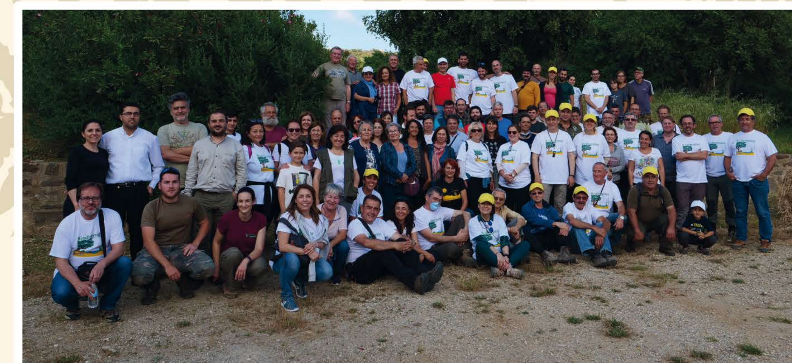
Bioblitz Montes de Propios 2018

El proyecto incluye además la reintroducción de un helecho acuático ( Marsilea batardae ), considerado hoy día como extinto en la zona y que es muy sensible a las alteraciones en las masas de agua y por tanto, al efecto del cambio climático.